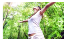
SOPHROLOGIE UN TEMPS POUR SOI