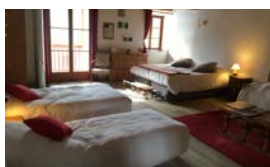
VOTRE HÉBERGEMENT « LES CHAMBRES D'ANAVO »