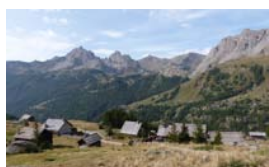
RANDONNÉE PÉDESTRE AU COEUR DE LA VALLÉE DE LA CLARÉE